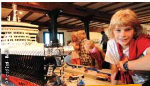
Int. Maritimes Museum