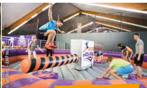
© Tom Wenz - JUMP House