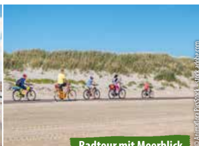
Radtour mit Meerblick